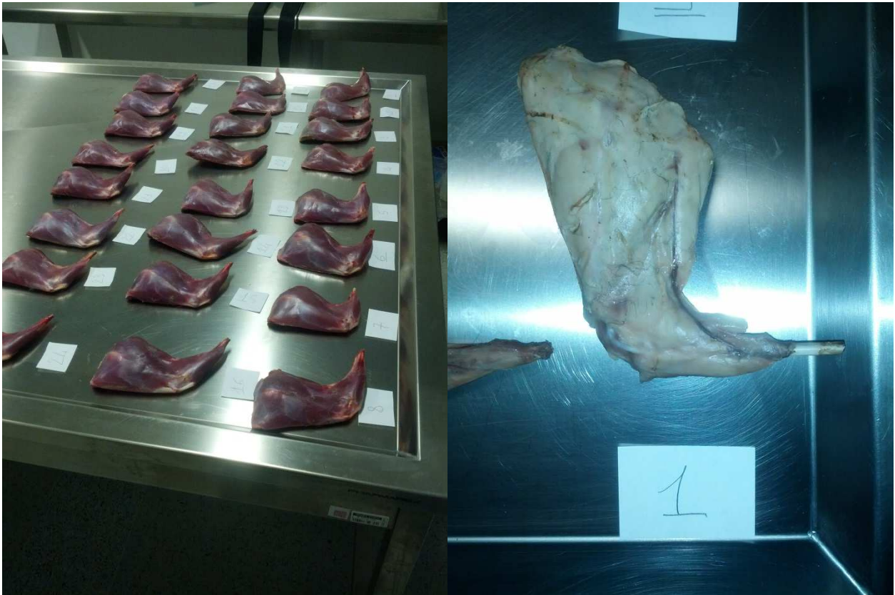
Arto posteriore per analisi reologiche pre e post cottura