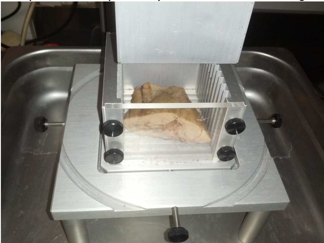
Campione arto posteriore posizionato in cella Allo-Kramer per determinazione sforzo di taglio