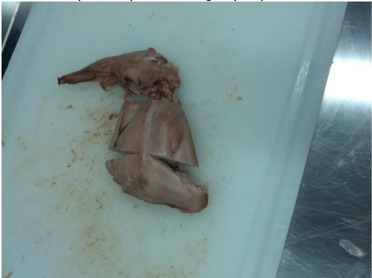
Preparazione arto posteriore per determinazione sforzo di taglio