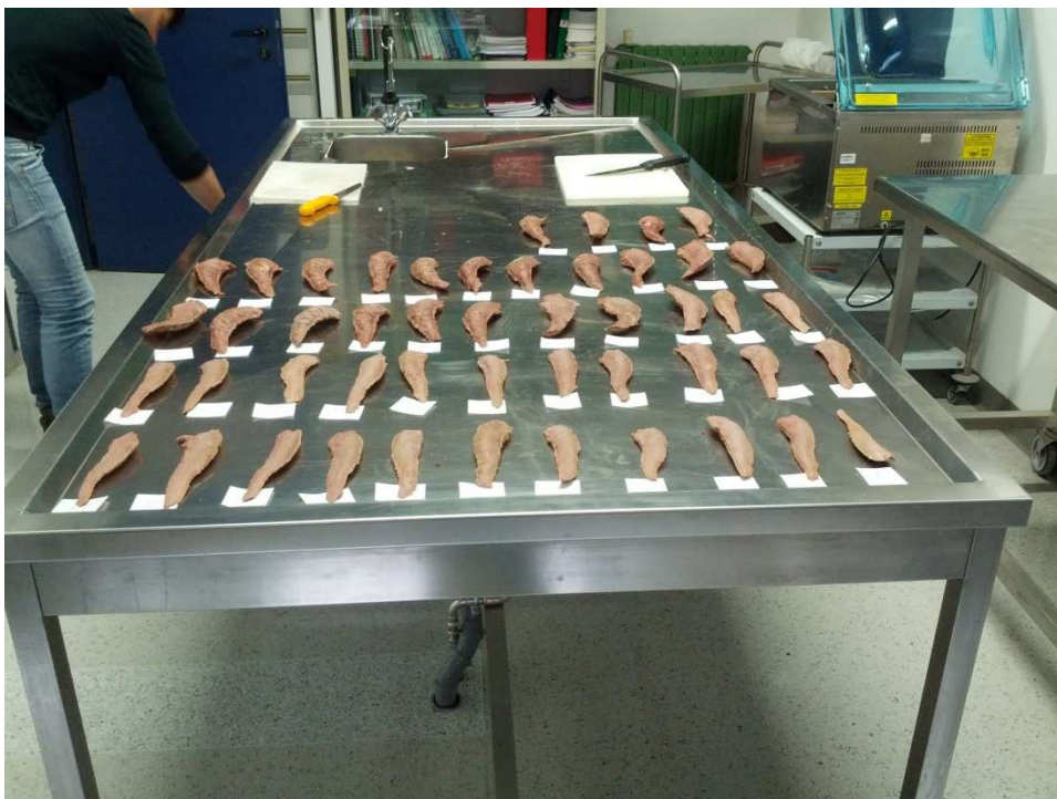
Longissimus lumborum per analisi reologiche